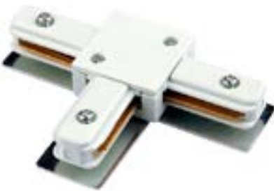
Acessorio Conector DL025B Material: Abs Cor: Branco Voltagem: Bivolt Medidas: 7,5cm x 10,5cm x 2,5cm