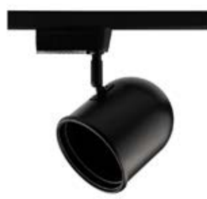
Spot De Sobrepor Beam DL042PG Material: Metal Cor: Preto Voltagem: Bivolt Potência: 1 x 50W Soquete: AR111 Lâmpadas: 1 Medidas: ø12cm x 20cm