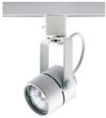
Spot De Sobrepor Pharos DL032B Material: Metal Cor: Branco Voltagem: Bivolt Potência: 50W Soquete: GU10 Lâmpadas: Dicroica Medidas: ø6cm x 16cm