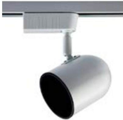
Spot De Sobrepor Beam DL038BG Material: Metal Cor: Branco Voltagem: Bivolt Potência: 1 x 50W Soquete: GU10 Lâmpadas: AR70 Medidas: ø9cm x 18cm