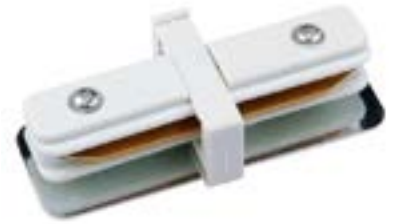
Acessorio Conector DL023B Material: Abs Cor: Branco Voltagem: Bivolt Medidas: 3,5cm x 8cm x 2cm