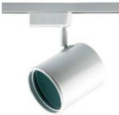
Spot De Sobrepor Beam DL052BG Material: Metal Cor: Branco Voltagem: Bivolt Potência: 1 x 50W Soquete: GU10 Lâmpada: AR111