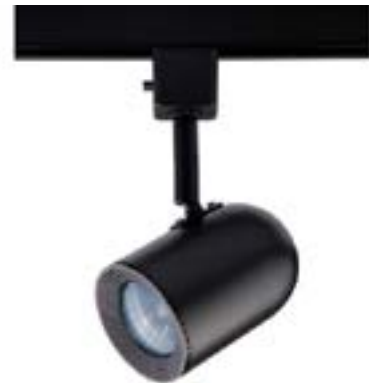
Spot De Sobrepor Pharos DL034P Material: Metal Cor: Preto Voltagem: Bivolt Potência: 50W Soquete: GU10 Lâmpadas: Dicroica Medidas: ø6,5cm x 14cm