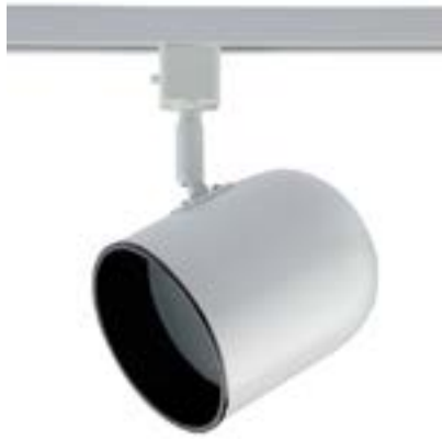
Spot De Sobrepor Beam DL040B Material: Metal Cor: Branco Voltagem: Bivolt Potência: 1x 40W Soquete: E27 Lâmpadas: PAR 30 Medidas: ø11cm x 20cm