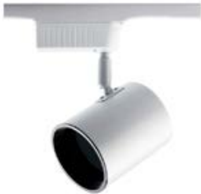
Spot De Sobrepor Beam DL048BG Material: Metal Cor: Branco Voltagem: Bivolt Potência: 1 x 50W Soquete: GU10 Lâmpada: AR70