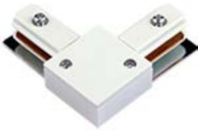
Acessorio Conector DL024B Material: Abs Cor: Branco Voltagem: Bivolt Medidas: 8cm x 9,5cm x 2cm