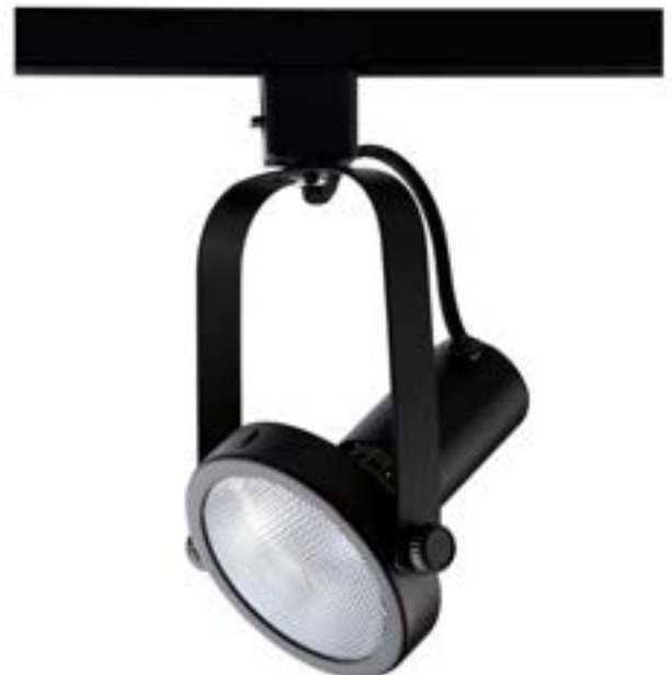
Spot De Sobrepor Basic DL031P Material: Metal Cor: Preto Voltagem: Bivolt Potência: 1 x 50W Soquete: E27 Lâmpada: PAR30 Medidas: ø10cm x 18cm