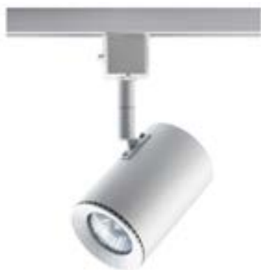
Spot De Sobrepor Beam DL044B Material: Metal Cor: Branco Voltagem: Bivolt Potência: 50W Soquete: GU10 Lâmpadas: Dicroica Medidas: ø6,5cm x 15cm