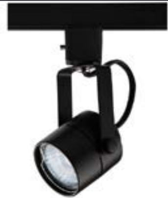
Spot De Sobrepor Pharos DL032P Material: Metal Cor: Preto Voltagem: Bivolt Potência: 50W Soquete: GU10 Lâmpadas: Dicroica Medidas: ø6cm x 16cm