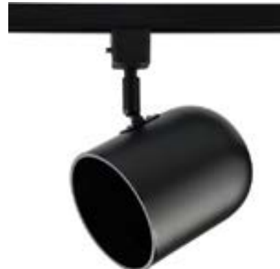
Spot De Sobrepor Beam DL040P Material: Metal Cor: Preto Voltagem: Bivolt Potência: 1 x 40W Soquete: GU10 Lâmpadas: AR70 Medidas: ø11cm x 20cm