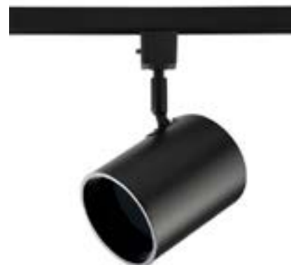
Spot De Sobrepor Beam DL048PG Material: Metal Cor: Preto Voltagem: Bivolt Potência: 1 x 50W Soquete: GU10 Lâmpada: AR70