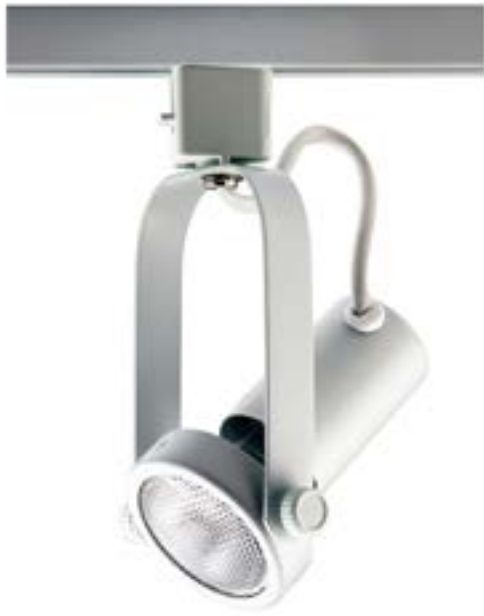
Spot De Sobrepor Basic DL030B Material: Metal Cor: Branco Voltagem: Bivolt Potência: 1x 40W Soquete: E27 Lâmpadas: PAR20 Medidas: ø6,5cm x 16cm