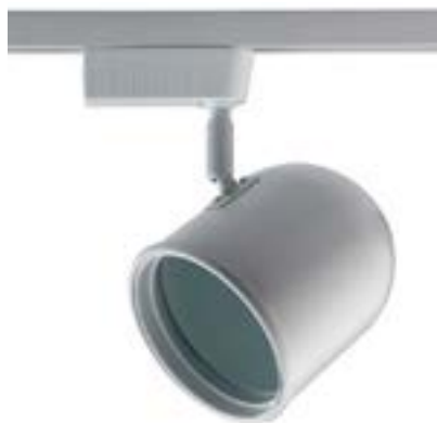
Spot De Sobrepor Beam DL042BG Material: Metal Cor: Branco Voltagem: Bivolt Potência: 1 x 50W Soquete: AR111 Lâmpadas: 1 Medidas: ø12cm x 20cm