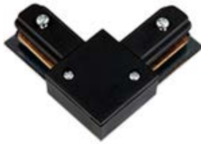
Acessorio Conector DL024P Material: Abs Cor: Preto Voltagem: Bivolt Medidas: 8cm x 9,5cm x 2cm