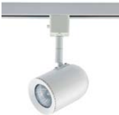
Spot De Sobrepor Pharos DL034B Material: Metal Cor: Branco Voltagem: Bivolt Potência: 50W Soquete: GU10 Lâmpadas: Dicroica Medidas: ø6cm x 15cm