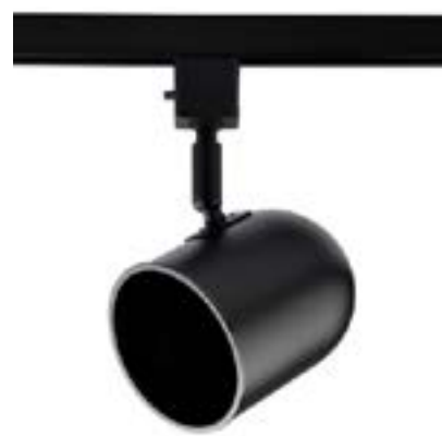
Spot De Sobrepor Pharos DL036P Material: Metal Cor: Preto Voltagem: Bivolt Potência: 40W Soquete: E27 Lâmpadas: PAR20 Medidas: ø9cm x 17cm