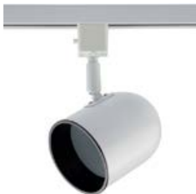
Spot De Sobrepor Pharos DL036B Material: Metal Cor: Branco Voltagem: Bivolt Potência: 40W Soquete: E27 Lâmpadas: PAR20 Medidas: ø9cm x 17cm