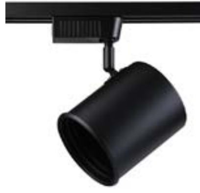
Spot De Sobrepor Beam DL052PG Material: Metal Cor: Preto Voltagem: Bivolt Potência: 1 x 50W Soquete: GU10 Lâmpada: AR111