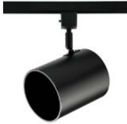
Spot De Sobrepor Beam DL050P Material: Metal Cor: Preto Voltagem: Bivolt Potência: 1 x 40W Soquete: E27 Lâmpada: PAR30 Medidas: ø11cm x 14cm