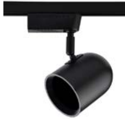
Spot De Sobrepor Beam DL038PG Material: Metal Cor: Preto Voltagem: Bivolt Potência: 1 x 50W Soquete: E27 Lâmpadas: PAR 30 Medidas: ø9cm x 18cm