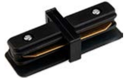
Acessorio Conector DL023P Material: Abs Cor: Preto Voltagem: Bivolt Medidas: 3,5cm x 8cm x 2cm