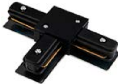
Acessorio Conector DL025P Material: Abs Cor: Preto Voltagem: Bivolt Medidas: 7,5cm x 10,5cm x 2,5cm