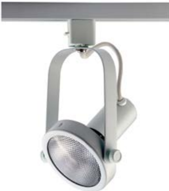
Spot De Sobrepor Basic DL031B Material: Metal Cor: Branco Voltagem: Bivolt Potência: 1 x 40W Soquete: E27 Lâmpada: PAR30 Medidas: ø10cm x 18cm