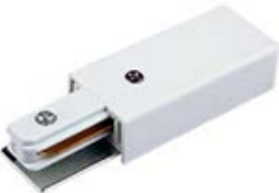
Acessorio Terminal DL026B Material: Abs Cor: Branco Voltagem: Bivolt Medidas: 3,5cm x 10,5cm x 2cm