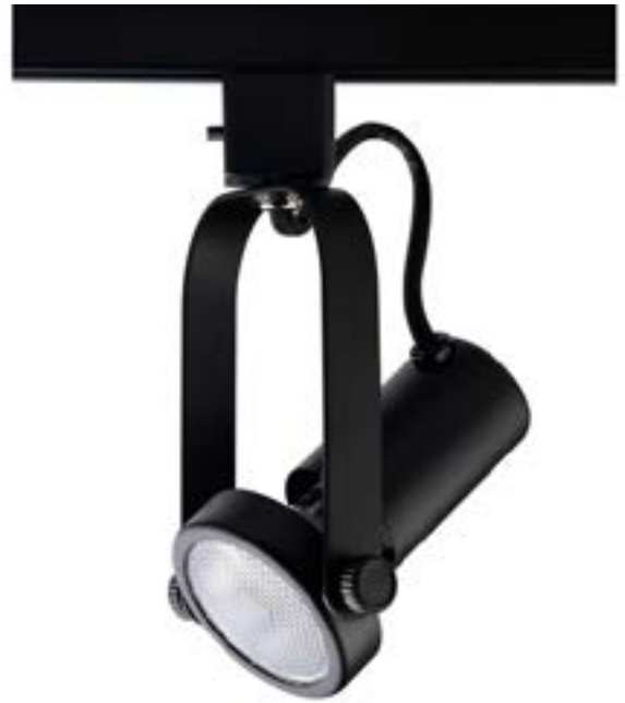
Spot De Sobrepor Basic DL030P Material: Metal Cor: Preto Voltagem: Bivolt Potência: 1 x 40W Soquete: E27 Lâmpadas: PAR20 Medidas: ø6,5cm x 16cm