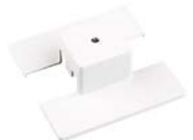
Acessório Base Para Trilho DL029B Material: Metal Cor: Branco Medidas: 11,5cm x 11,5cm x 3,5cm