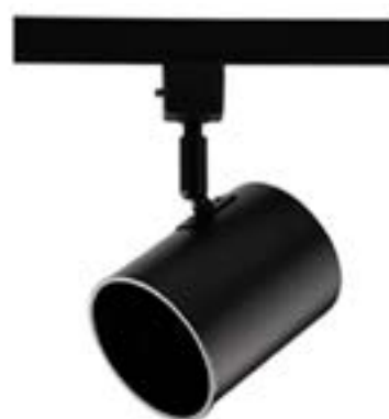
Spot De Sobrepor Beam DL046P Material: Metal Cor: Preto Voltagem: Bivolt Potência: 50W Soquete: E27 Lâmpadas: PAR20 Medidas: ø9cm x 16cm