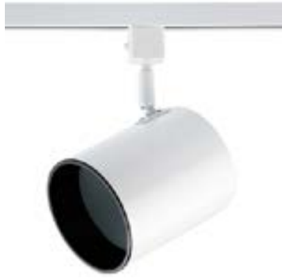
Spot De Sobrepor Beam DL050B Material: Metal Cor: Branco Voltagem: Bivolt Potência: 1 x 40W Soquete: E27 Lâmpada: PAR30 Medidas: ø11cm x 14cm