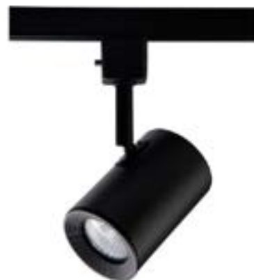
Spot De Sobrepor Beam DL044P Material: Metal Cor: Preto Voltagem: Bivolt Potência: 50W Soquete: GU10 Lâmpadas: Dicroica Medidas: ø6,5cm x 15,5cm