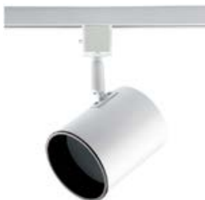
Spot De Sobrepor Beam DL046B Material: Metal Cor: Branco Voltagem: Bivolt Potência: 40W Soquete: E27 Lâmpadas: PAR20 Medidas: ø9cm x 16cm