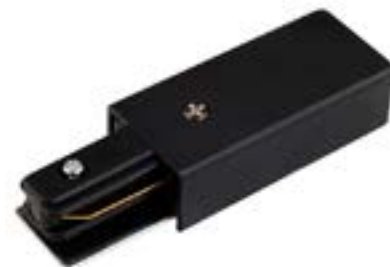
Acessorio Terminal DL026P Material: Abs Cor: Preto Voltagem: Bivolt Medidas: 3,5cm x 10,5cm x 2cm